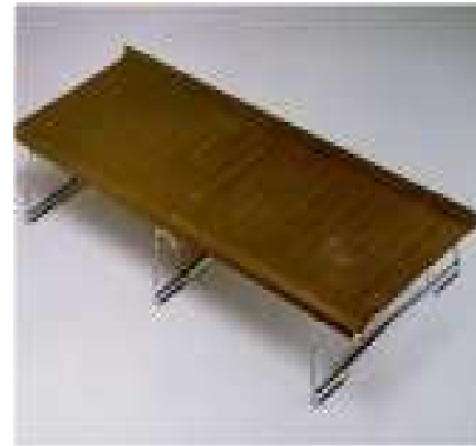
Lit de camp