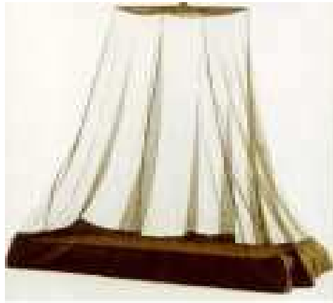
Lit de camp avec moustiquaire