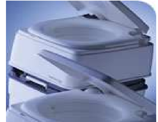
WC portables (aucun usage de produits chimiques)