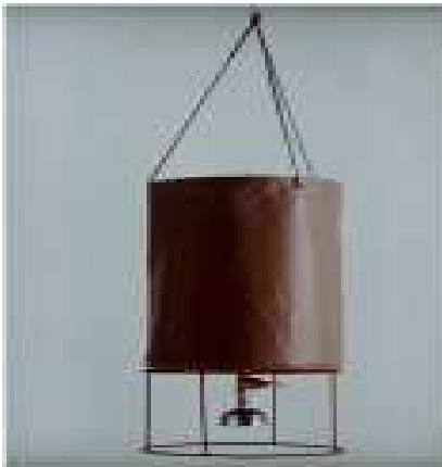
Réservoir de douche

Photos du matériel ci dessous : les douches et WC portables sont installés pour les bivouacs privés uniquement (espaces exclusifs réservés)